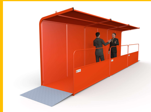
Ankaa 1200F sur plateau

Plancher anti-dérapant en tôle gaufrée (ép. 3mm)